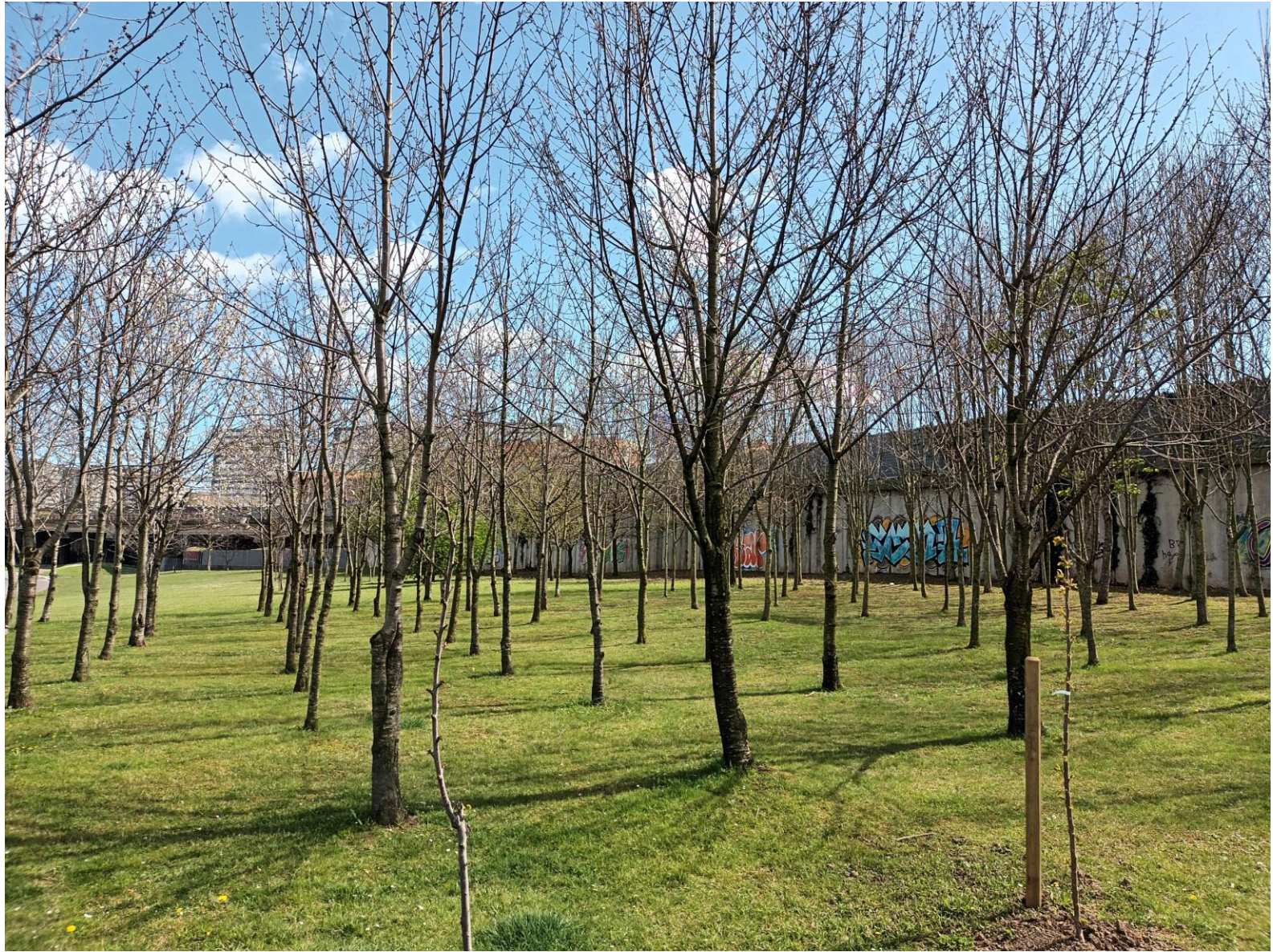
La comunidad de barrio*: el bosque como horizonte.