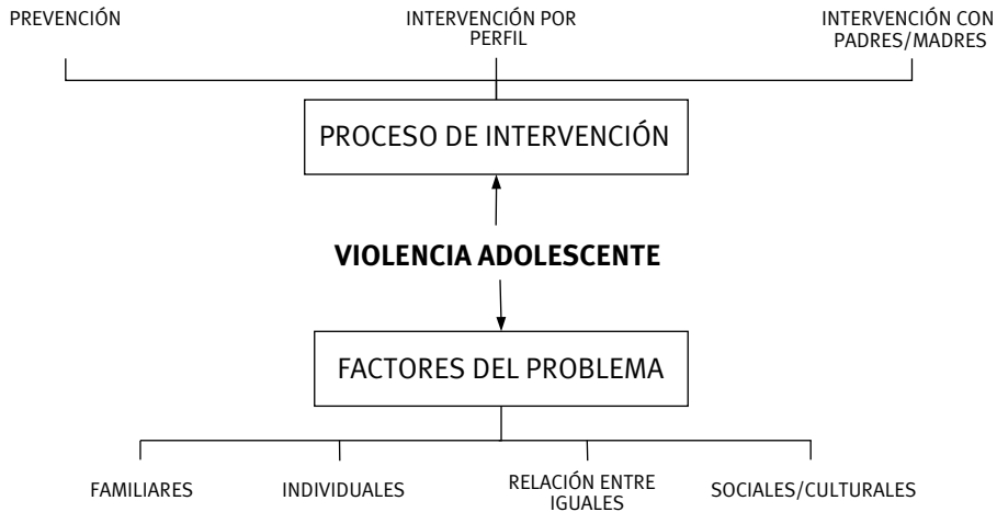
Gráfico 1. Factores causantes del problema y proceso de intervención.