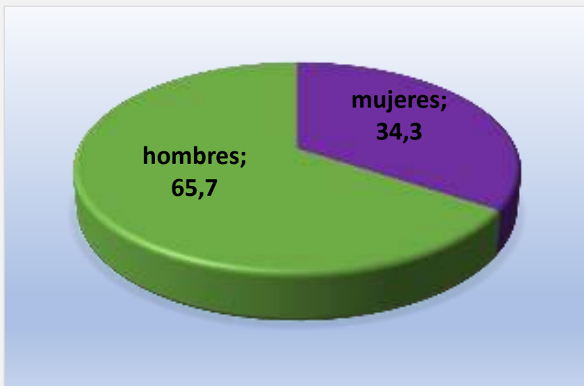
% Intervenciones Ataubizu

(Acompañamientos, acogidas, asistencias en domicilio y visitas hospitalarias)