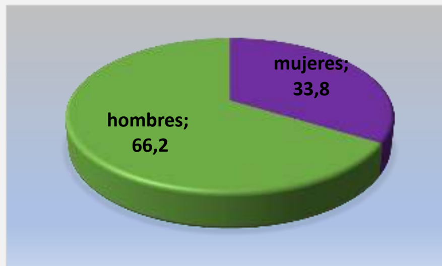
% Acogidas Ataubizu

(Acompañamientos, acogidas, asistencias en domicilio y visitas hospitalarias)